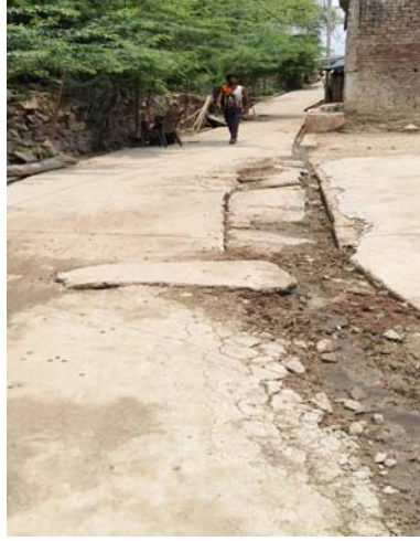
मनरेगा में चल रही रोजगार सहायक की मनमानी

शयोपुर ( चम्बल नवराष्ट्र ) । शयोपुर जिले को ग्राम पंचायत पांडोला में बाल्मीकि बस्ती से नसीर जी तक बनाई गई सीसी सड़क एक बारिश नहीं झेल सकी। नतीजतन लाखों रुपए की लागत से बनाई गई यह सड़क जगह जगह से उखड़ने लगी है। इस सड़क के निर्माण में ग्राम पंचायत द्वारा गुणवत्ताहीन सामग्री का बेजा इस्तेमाल किया गया। वहीं सरपंच सचिव ने इस निर्माण कार्य में मानकों के आधार पर कार्य नहीं किया। सड़क निर्माण में कम मात्रा में सीमेंट डालने के कारण यह जगह जगह से टूट गई है। इसकी मोटाई छह इंच की बजाय तीन इंच की गई इसके चलते यह सीसी सड़क कुछ महीने भी नहीं टिक पाएगी। घटिया निर्माण को लेकर बाल्मीकि बस्ती के वासिंदे इस मामले की शिकायत पंचायत एवं ग्रामीण विभाग के अधिकारियों से करने की भी बात कह रहे हैं।