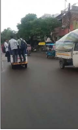
जाने वाले मार्ग का है। ई रिक्शा एमपी 13 आरए 1180 का चालक अपना वाहन लापरवाही पूर्वक चला ही रहा है, साथ ही उसने ई-रिक्शा

उज्जैन ( चम्बल नवराष्ट्र )। ई-रिक्शा चालकों की रुपए कमाने की चाहत कम होती नजर नहीं आ रही है। ई रिक्शा चालक ज्यादा से ज्यादा रुपए कमाने के चक्कर में श्रद्धालुओं की जान को आफत में डाल रहे हैं। शहर में एक ऐसा ही वीडियो वायरल हो रहा है, जिसमें एक ई रिक्शा में पांच या छह नहीं, 12 श्रद्धालु बैठे हुए हैं। ई-रिक्शा चलाने वाला व्यक्ति यातायात के नियमों का उल्लंघन करते हुए सरपट अपने वाहन को दौड़ा रहा है। उसे इस बात का कोई डर नहीं है कि अगर किसी भी लापरवाही से यह वाहन पलटता है तो आखिर क्या होगा।